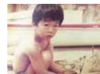
夏は毎日海に行っていました。