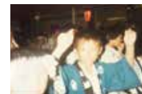
小さい時は阿波踊り神輿は中野で覚えました。